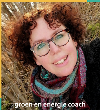
groen en energie coach